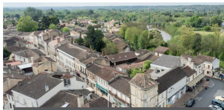
Vue aérienne du centre-bourg & projection - Montpon-Ménéstérol

L'EPFNA a consenti une minoration foncière pour contribuer à l'équilibre financier de l'opération. L'Établissement a contribué sur ses fonds propres au financement des travaux de démolition et de dépollution des bâtiments via une minoration foncière d'un montant de 100 000 € et cède ainsi une emprise prête à bâtir à l'opérateur.