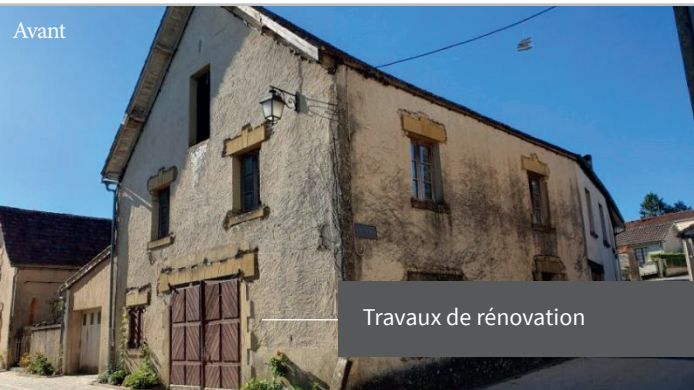
Travaux de rénovation

L'EPFNA a finalisé une 1 ère cession à la collectivité, qui a mené les travaux de rénovation et d'aménagement d'une galerie d'art qui a ouvert ses portes à l'été 2023, et d'un logement.