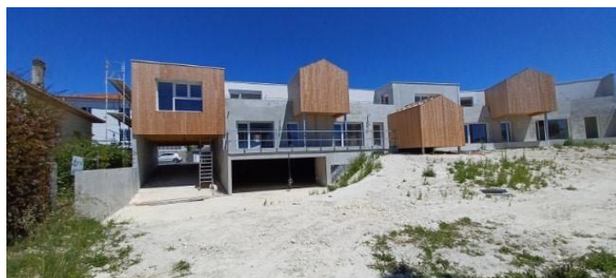
PC5 Façades & Toitures

Cette opération représente pour Eden un montant d'investissement de près de 7M€, dont 550 000 € pour l'achat du foncier. De son côté, l'EPFNA contribue à l'équilibre financier et à la sortie de cette opération en prélevant 750 000€ sur le fonds SRU, constitué des pénalités versées par les communes déficitaires au regard des objectifs de production de logement social.